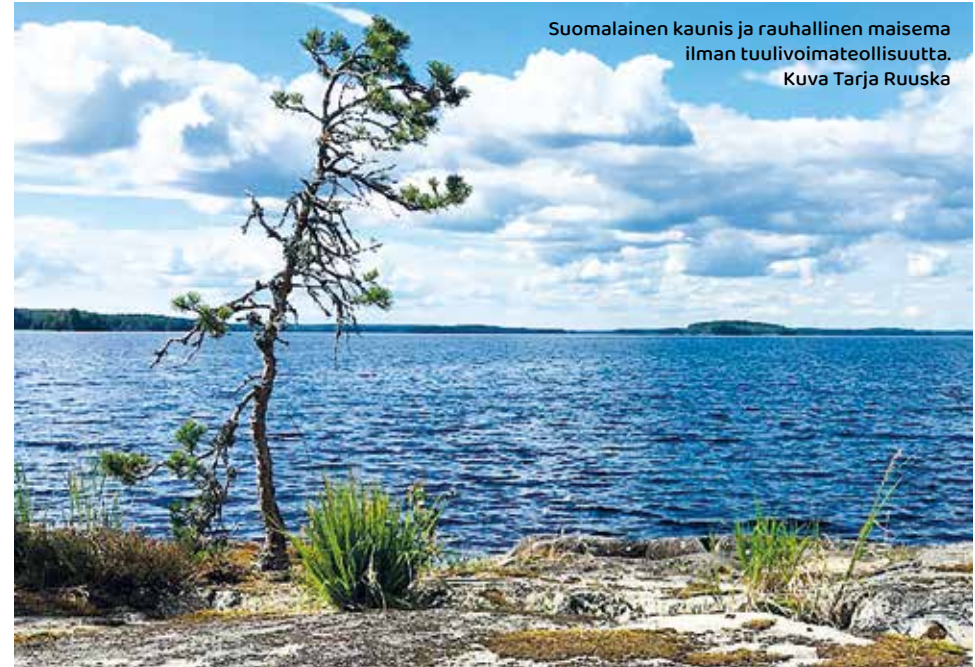
Suomalainen kaunis ja rauhallinen maisema ilman tuulivoimateollisuutta.

Tämän yhteenvedon tarkoituksena on tarjota asukkaalle työkaluja tuulivoimahankkeiden arviointiin, asukkaiden oikeusturvan varmistamiseen ja tuulivoimaloiden haittojen ehkäisyyn.