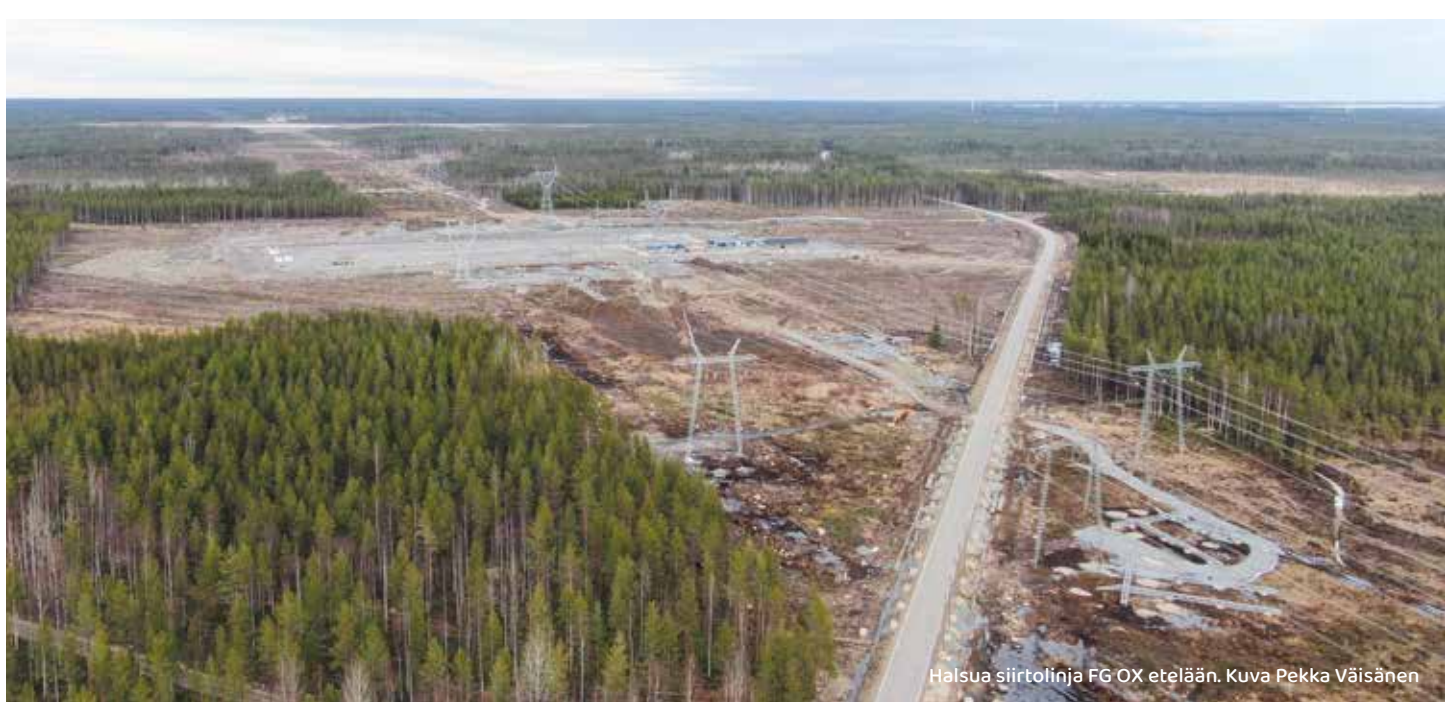
Halsua siirtolinja FG OX etelään.

Yhteiskunnan tarvehierarkiassa sähkönsiirto menee lähes kaiken muun yli. Kun valtiollinen