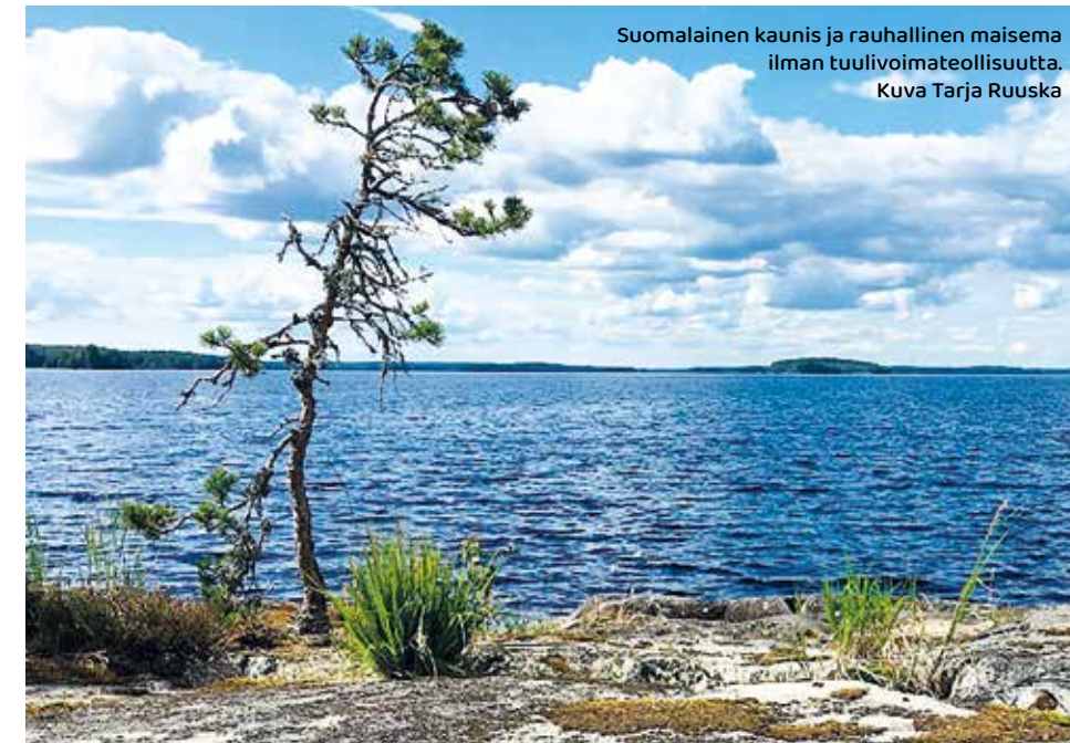
Suomalainen kaunis ja rauhallinen maisema ilman tuulivoimateollisuutta.

Tämän yhteenvedon tarkoituksena on tarjota asukkailla työkaluja tuulivoimahankkeiden arviointiin, asukkaiden oikeusturvan varmistamiseen ja tuulivoimaloiden haittojen ehkäisyyn.