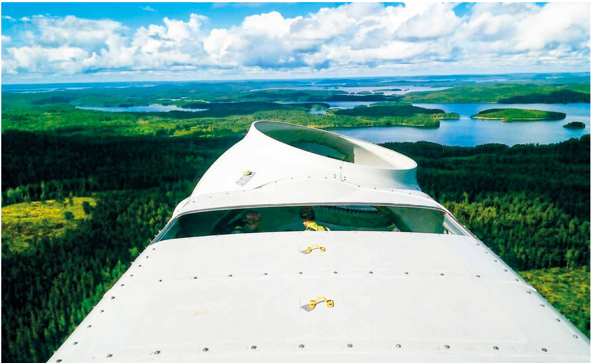
Puolalaisten rakentajien kuva Luhangan Latamäen tuulivoimaloiden pystytustyömaalta v. 2014. Näiden voimaloiden meluhaitoista käytävä oikeudenkäynti on kestänyt 11 vuotta ja se jatkuu edelleen.

tapahtuvat pääosin ulkomailta. Kiinteistövero tulot eivät kata vahinkoja ja haittoja eikä purkuvakuudet purkamiskuluja. Kunnille on tulossa todella merkittävät kustannukset seuraavien vuosikymmenten aikana.