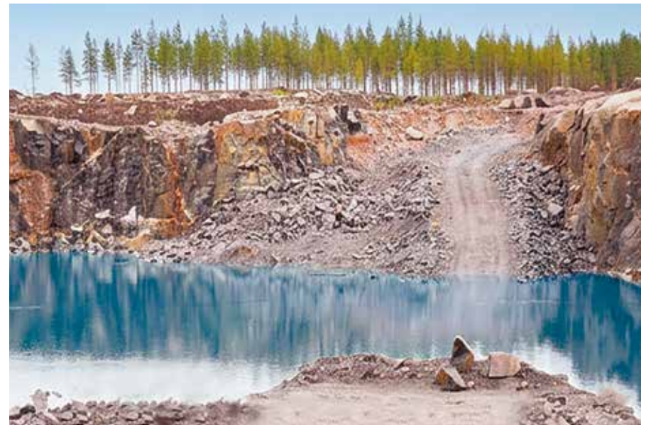
Louhos Lestijärven tuulivoimaloiden rakennustyömaalta v. 2023.

Anna äänesi kuulua kotiseutusi ja sen luonnon puolesta.