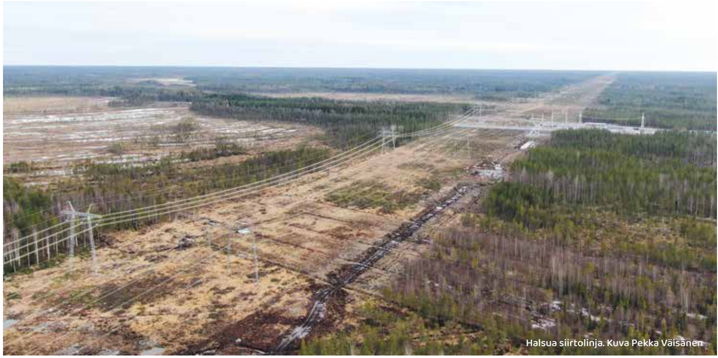
Halsua siirtolinja.

Mikä on teräksinen jättiläinen, joka on kasvanut joka suuntaan ja joka häiritsee ja haittaa elämäämme? Se on sähkönsiirtolinja, ja vasta viime aikoina siihen on alettu kiinnittää huomiota.